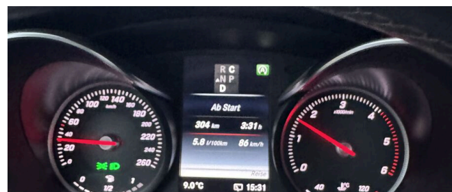
Bestwert 5,8 l / 100 km · über 304 km bei konstanter Fahrweise