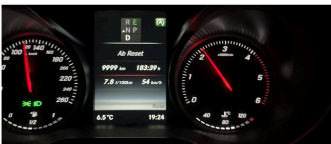
Ø 7,8 l / 100 km · real über 9.999 km — ein halbes Jahr Alltag