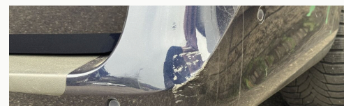
Heckstoßstange · Schramme