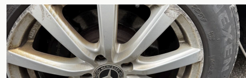
Alufelge · Gebrauchsspuren

* Lack im Schein als „blau“ — Cavansitblau metallic, im Alltag edel dunkelblau.